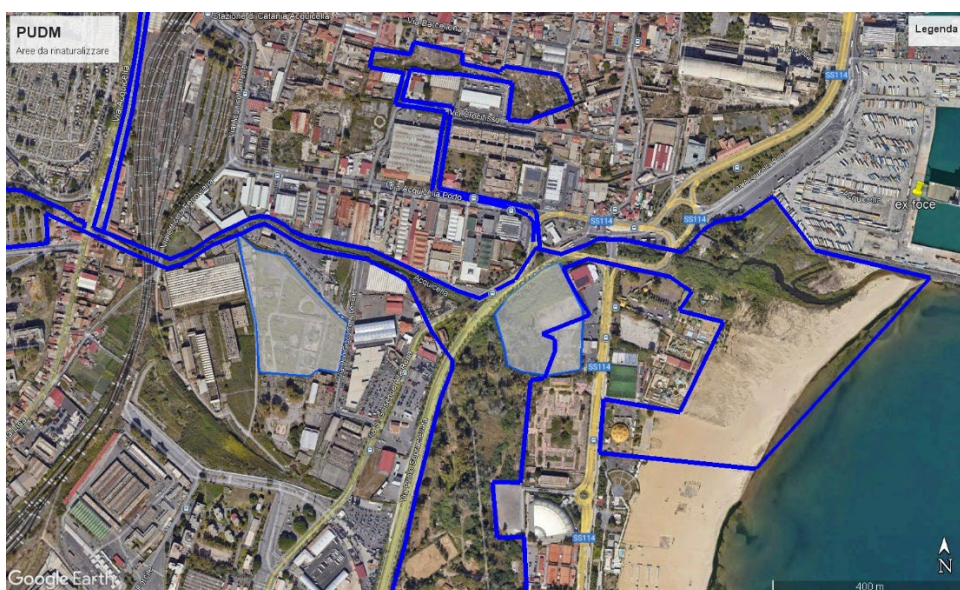
Fig. 2: le aree campite sono degli esempi di aree ancora libere che potrebbero venire destinate a bacini di laminazione per ridurre allagamenti e rischio idraulico agli edifici di Via Acquicella porto.