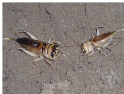
Fig. 4: specie presenti nelle Direttive Europee Uccelli e Habitat, Pollo sultano presente nei canneti delle sponde dell'Acquicella e Brachytrupes megacephalus presente nelle dune embrionali.