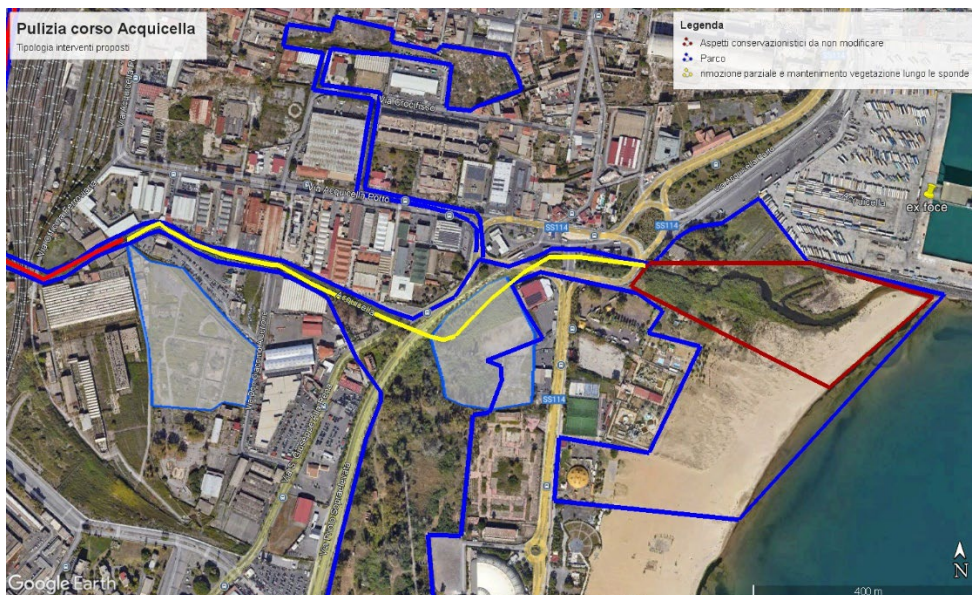
Fig. 1: Parte terminale dell'Acquicella, in rosso mattone l'area più importante sotto l'aspetto naturalistico e conservazionistico del tratto terminale del corso d'acqua Acquicella; in giallo il tratto in cui si propone la pulizia parziale mantenendo parte della vegetazione lungo le sponde e riducendo l'altezza di quella sul fondo, in modo da salvaguardare la fauna selvatica.